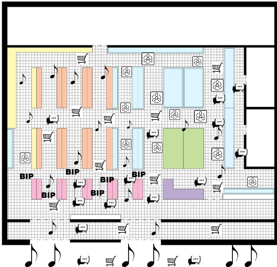
Schéma du supermarché avec les différents bruits en pictogrammes